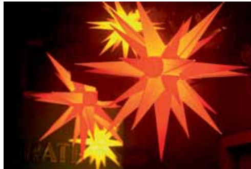
Weihnachtsgottesdienste Seite 19