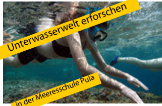
Unterwasserwelt erforschen in der Meeresschule Pula