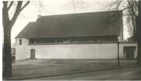
Kirchweihjubiläum St. Martinus Seite 18