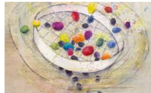
Motiv von Stefanie Bahlinger, Mössingen, www.verlagambirnbach.de

„Prüft alles und behaltet das Gute!“ meint, sich vor Neuem, Ungewohntem nicht zu fürchten, um es dann vorschnell durchs Raster fallen zu lassen. Es ermutigt, alles erst einmal anzuschauen, gewissenhaft zu prüfen und miteinander im Gespräch zu bleiben.