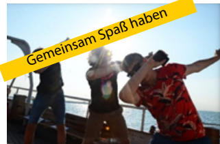
Gemeinsam Spaß haben