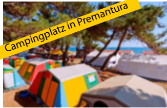
Campingplatz in Premantura