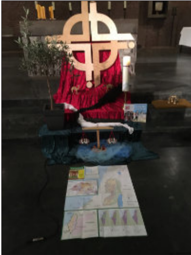
WGT-Schmuck in St. Agnes