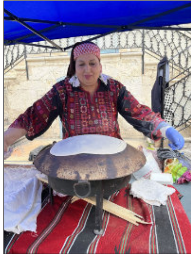
Fladenbrotbäckerin auf einem Altstadtfest in Jerusalem

Christinnen erstellt. Sie gaben uns einen Einblick in die Lebensumstände, die in den letzten Jahrzehnten in Palästina herrschten, und in die Auswirkungen der Nakba, der Katastrophen der Vertreibung aus der Heimat. Ergänzt wurde das durch Informationen und Fürbitten zu