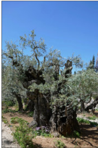
Olivenbäume im Garten Gethsemane

ren Liedern, die von den Instrumenten und Stimmen der kleinen Musikgruppe vielstimmig zum Erklingen gebracht werden. Dazu gehören zum Beispiel das Mut machende „Singt vom Leben, wie es ist, hart und schön“, das mit dem Aufruf „Singt vom Leben, nicht vom Tod!“ endet, und der „Menschheitsfriedens- traum“, in dem der